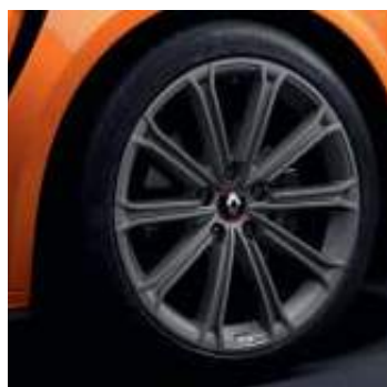
Llanta R.S. Estoril 46 cm (18")