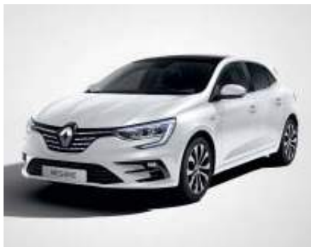
Blanco Nacarado (2)