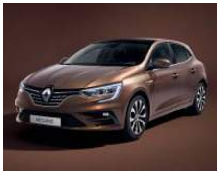
Cobre Solar (2)