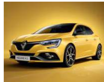
Amarillo Racing (2)

(1) Pintura opaca. (2) Pintura metalizada. Fotos no contractuales.