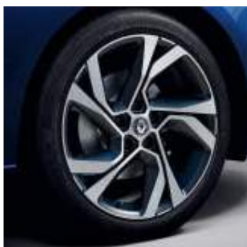
Llanta R.S. Line Magny-Cours 46 cm (18")