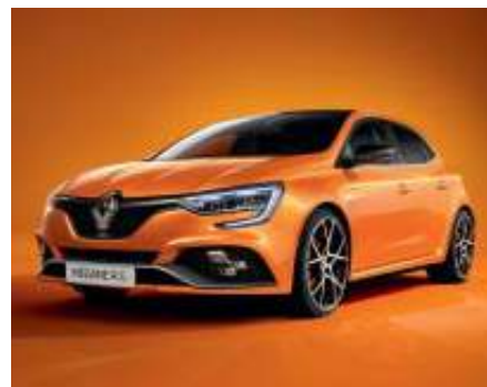
Naranja Tonic (2)