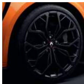
Llanta R.S. Interlagos Negra 48 cm (19")