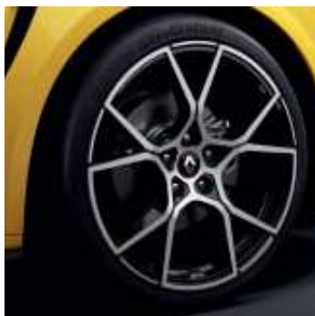
Llanta R.S. Trophy Fuji Light 48 cm (19")