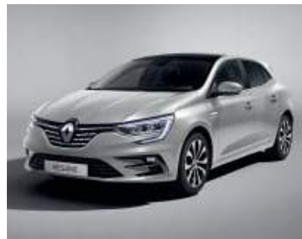
Gris Highland (2)