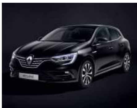
Negro Brillante (2)