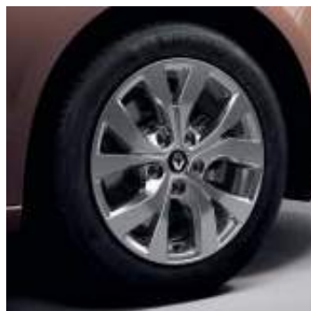
Llanta aleación Celsius 41 cm (16")