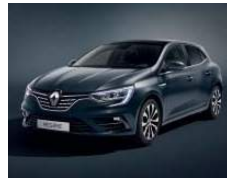
Gris Titanium (2)