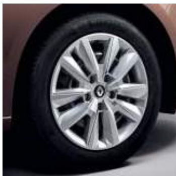
Flexwheel Eliptik 41 cm (16")