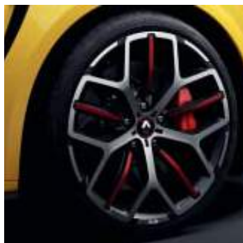
Llanta R.S. Trophy Jerez 48 cm (19")