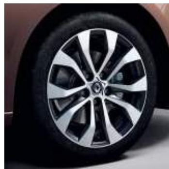
Llanta aleación Allium 43 cm (17")