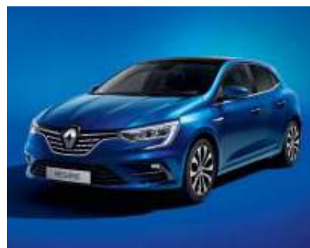
Azul Rayo (2)