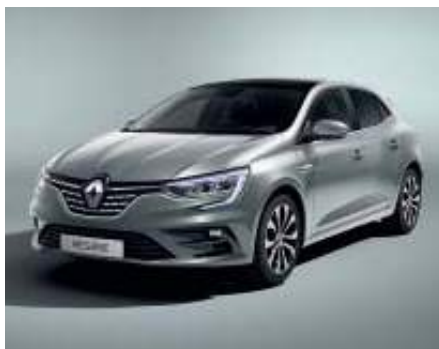
Gris Báltico (2)