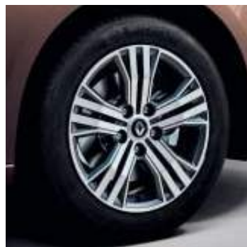
Llanta aleación Impulse 41 cm (16")