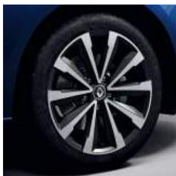
Llanta R.S. Line Montlhery 43 cm (17")