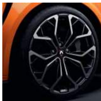
Llanta R.S. Interlagos Diamantada Negra 48 cm (19")