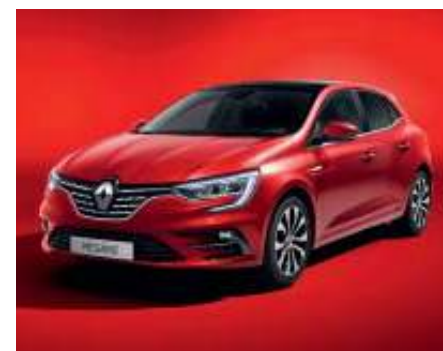
Rojo Deseo (2)