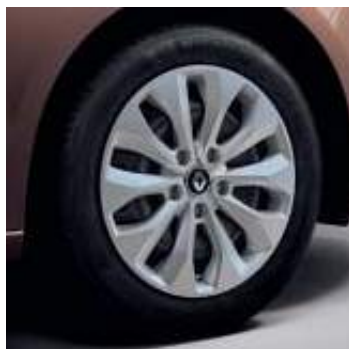
Embelledor Florida 41 cm (16")