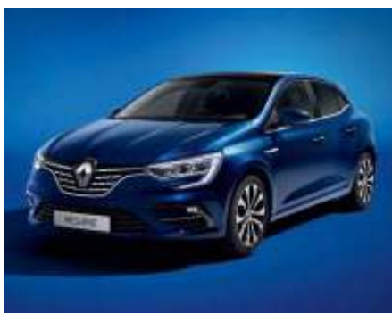
Azul Cosmos (2)