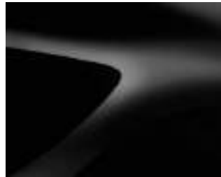
NEGRO NACARADO (2)