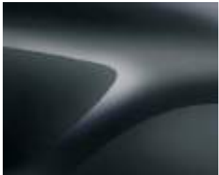
GRIS COMETA (2)