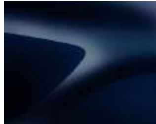
AZUL MARINO (1)