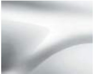
BLANCO GLACIAR (1)