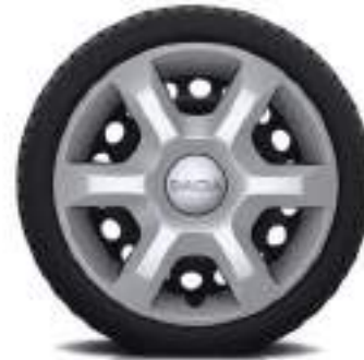
EMBELLECEDORES ARACAJU 38 CM (15")